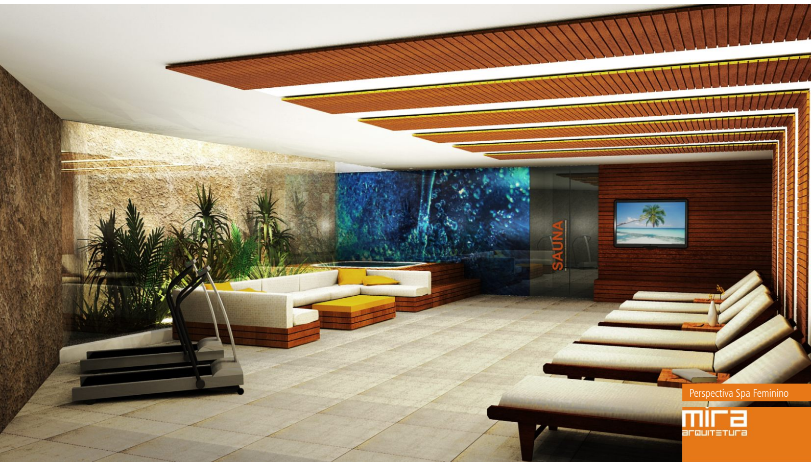
Perspectiva Spa Feminino

A materialidade proposta busca o conforto, combinando painéis ripados de madeira nas paredes e nos tetos, pisos antiderrapantes, painéis adesivados com temática "água" e paredes brancas.