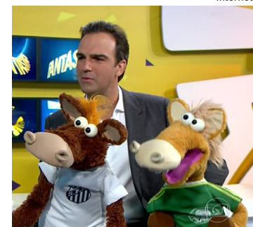
Cavaliños do Fantástico virou mania no futebol brasileiro

Alguns sócios e diretores do Jockey Club Brasileiro estão estudando uma forma de misturar o futebol e as corridas na Gávea. Os clubes de futebol estariam representados nas blusas utilizadas pelos jóqueis durante a competição e uma pontuação seria criada. No decorrer do torneio, o clube campeão seria aquele que conseguisse mais pontos nas disputas. Sem dúvida seria uma forma de atrair os amantes do